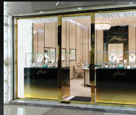
LA TUA GIOIELLERIA FINITA YOUR FINISHED JEWELRY SHOP

LONDON ROMA GENÈVE SAN FRANCISCO MOSCOW FIRENZE PARIS MILANO NEW YORK BUDAPEST CAPRI BALATON TORINO ZAGREB