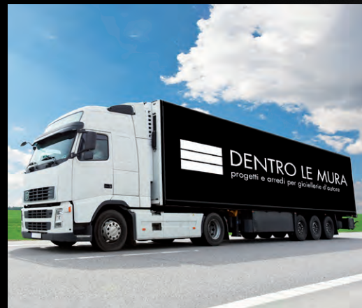
SPEDIZIONE E MONTAGGIO DELIVERY AND INSTALLATION