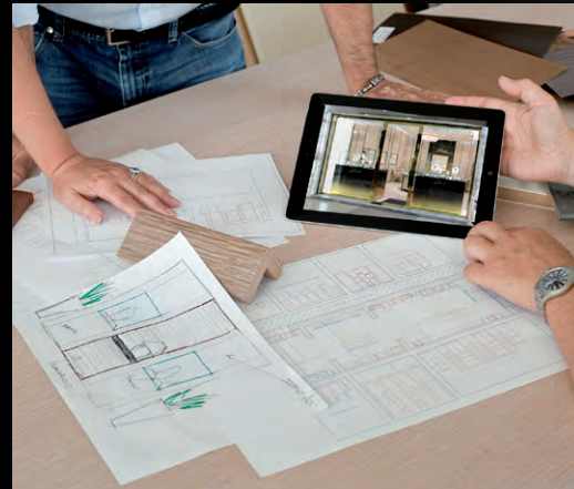
SVILUPPO PROGETTO PROJECT DEVELOPMENT